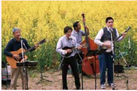
群馬県内の平和コンサートやイベント、ライブで自然と環境をテーマに演奏。

催し物も盛りだくさん THE WISKY BROSSAM (カントリーから沖縄楽曲まで)