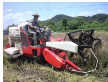
コンバインでの収穫