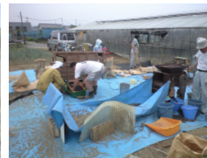
暑い中での精選・袋詰め作業