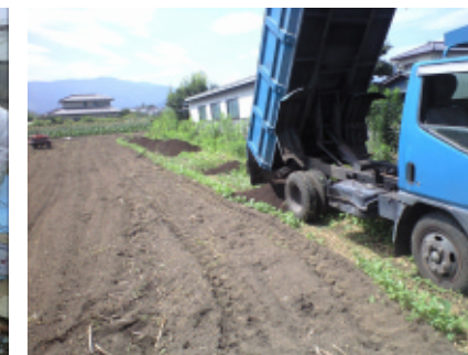
来年に向けて肥料まき