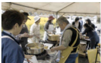
手打ちうどんと天ぷらがおいしかったです