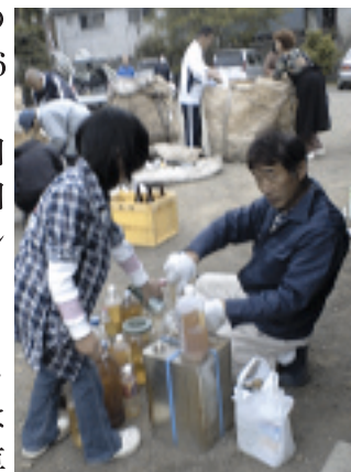
21区での廃油回収の様子

甘楽町21区では区民の皆さんの協力で、4月26日から資源ゴミの日に、家庭で残った食用油の回収を始めました。第1回目の回収には35リットルの廃油が集まりました。皆さんの家庭や近所でも廃油をためて置いて下さると助かります。BDFはトラクターなどの農耕車の燃料にします。