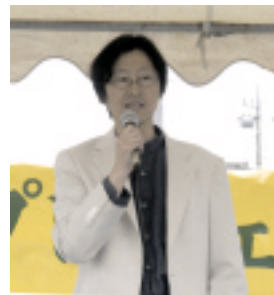
強矢代表があいさつ