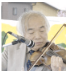
バイオリンの高橋先生