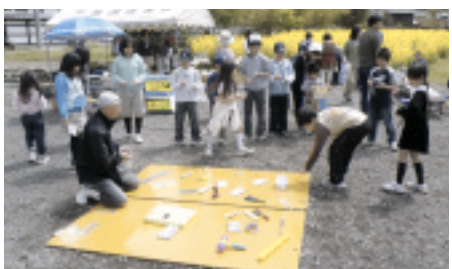
輪投げゲームは子ども達に好評でした