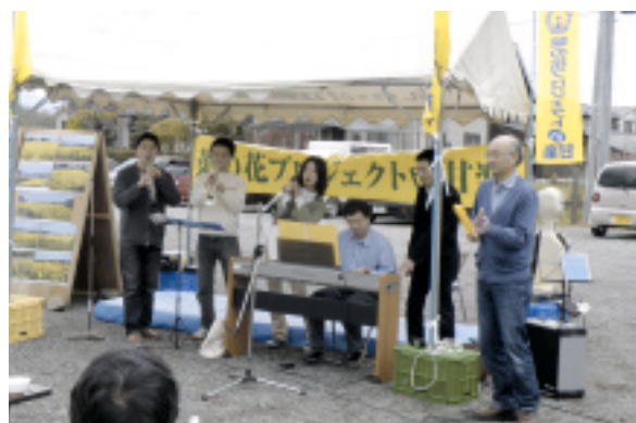
毎年恒例、デリコルの皆様の演奏

楽しみにしていたお花見の集いが、心配された天候もクリアし雨も降らず、56名の参加で行うことができました。前日より料理や準備に携わってくれた方々には大変お疲れさまでした。また当日参加してくれた方々に心よりお礼を申し上げます。大人数のなか行き届かないところもあったと思いますが、今後とも「菜の花プロジェクトin甘楽」を応援して下さい。よろしくお祈りします。