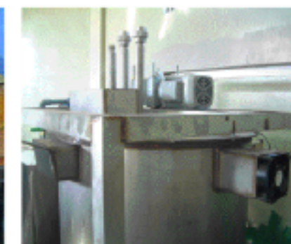
排気するところあり