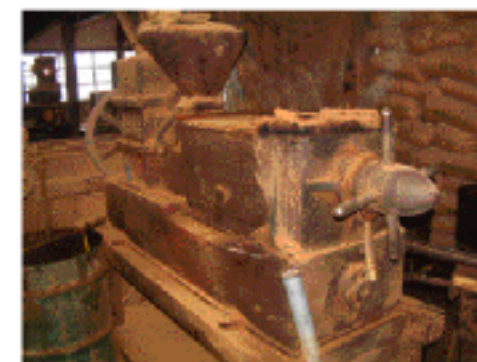
搾油機が古くて大きい