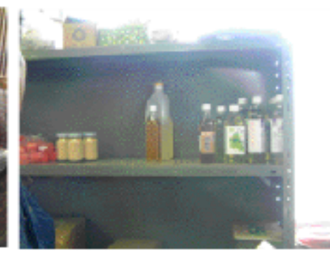
ヤマキさんの製品