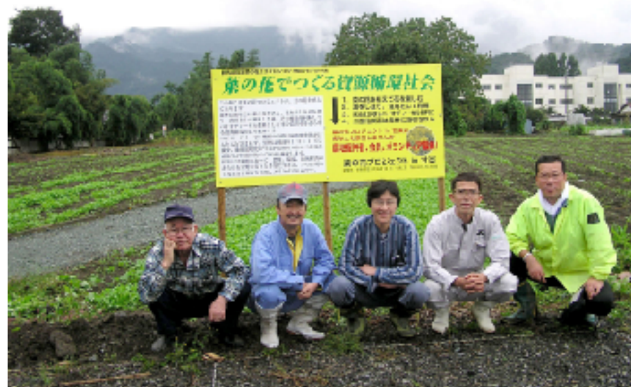
中小路の看板立てを終えて

10月18日(火)、5人の会員の参加で4ヶ所の畑に菜の花プロジェクトの看板を立てました。これで、この畑は、何をやる畑なのか町民に知らせることができますね。