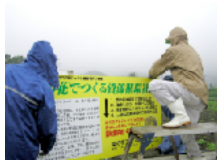
小雨の中での作業

10月18日(火)、5人の会員の参加で4ヶ所の畑に菜の花プロジェクトの看板を立てました。これで、この畑は、何をやる畑なのか町民に知らせることができますね。